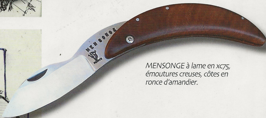
MENSONGE à lame en xc75, émoutures creuses, côtes en ronce d'amandier.