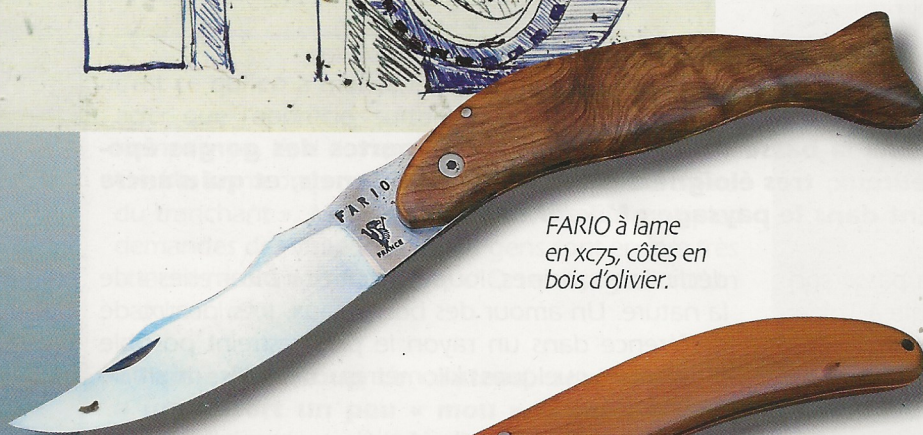
FARIO à lame en xc75, côtes en bois d'olivier.