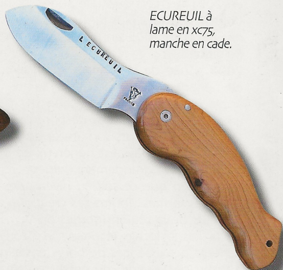
ECUREUIL à lame en xc75, manche en cade.