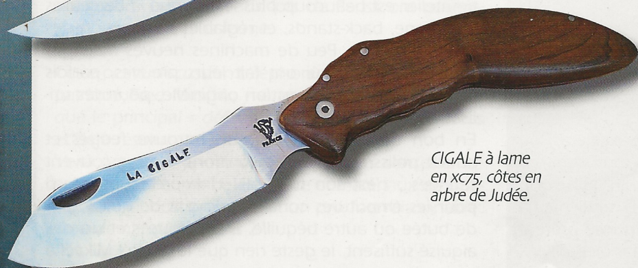
CIGALE à lame en xc75, côtes en arbre de Judée.