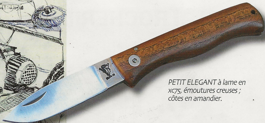
PETIT ELEGANT à lame en xc75, émoutures creuses ; côtes en amandier.