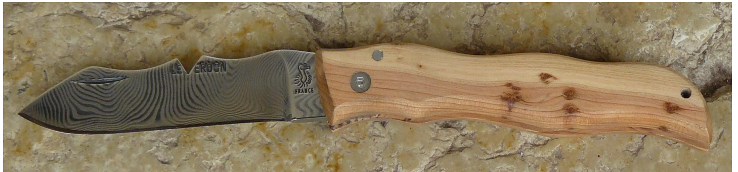
Manche : cade aussi appelé Genévrier cade ( Juniperus oxycedrus ), vissé.