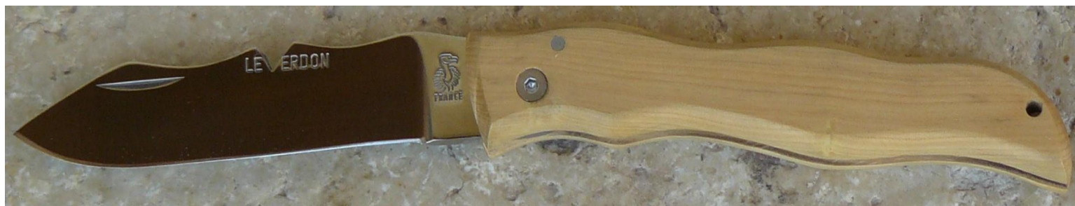
Manche : buis, vissé.