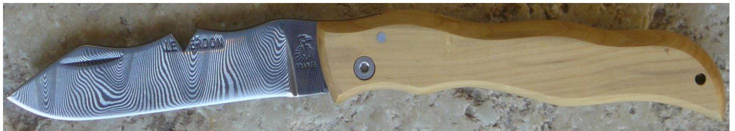
Manche : buis, vissé.