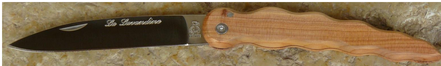
Manche : cade aussi appelé Genévrier cade ( Juniperus oxycedrus ), vissé.