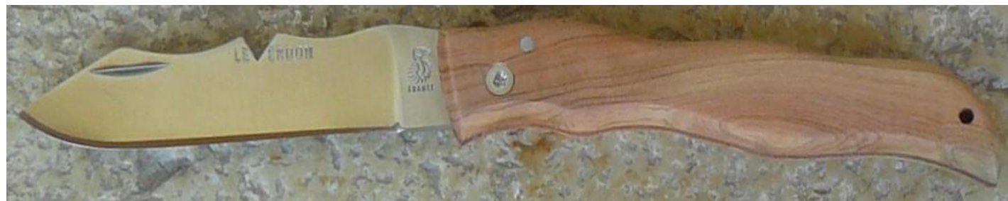
Manche : cade aussi appelé Genévrier cade ( Juniperus oxycedrus ), vissé.