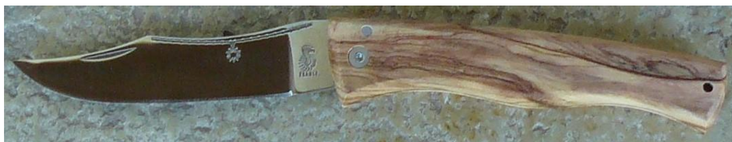
Manche : olivier, vissé.