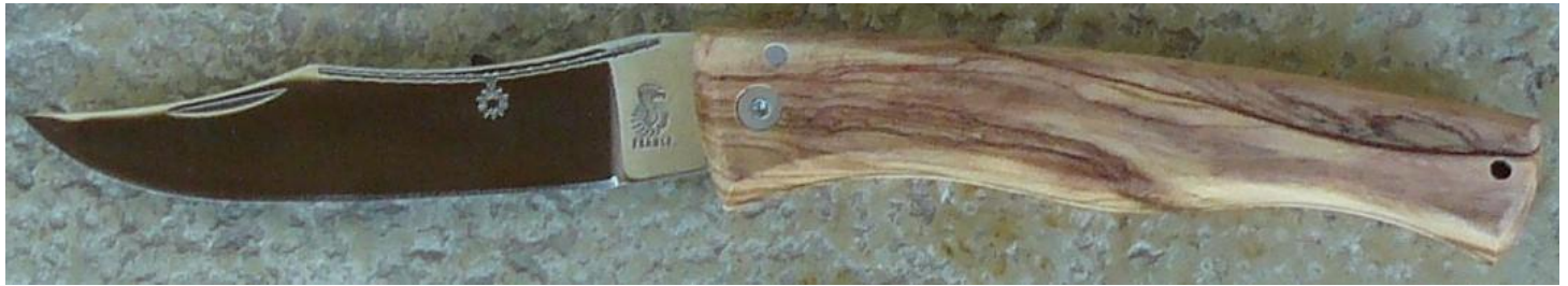
Manche : olivier, vissé.