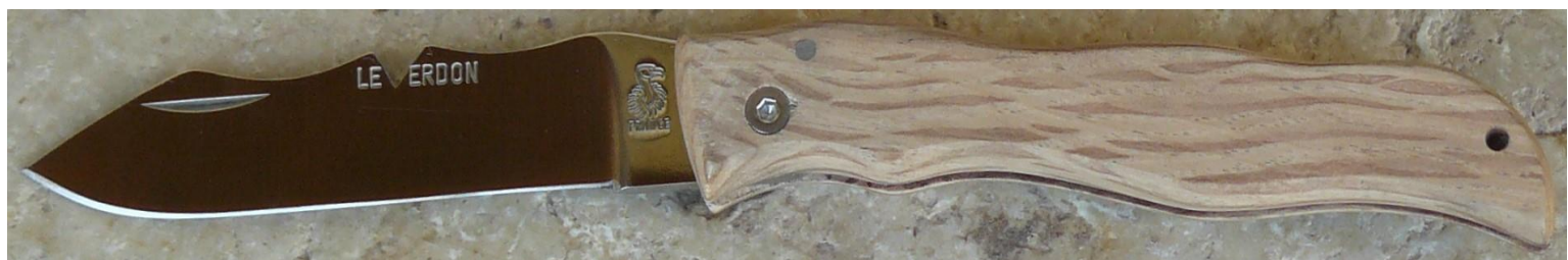
Manche : chêne vert, vissé.