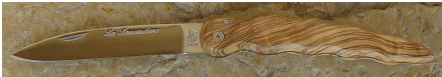
Manche : olivier, vissé.