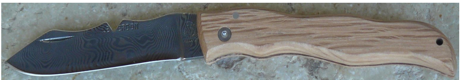
Manche : chêne vert, vissé.