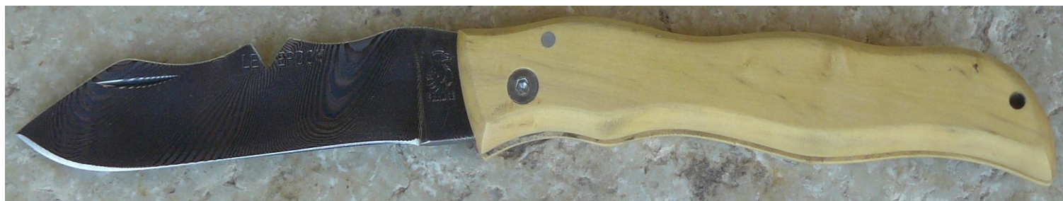
Manche : buis, vissé.