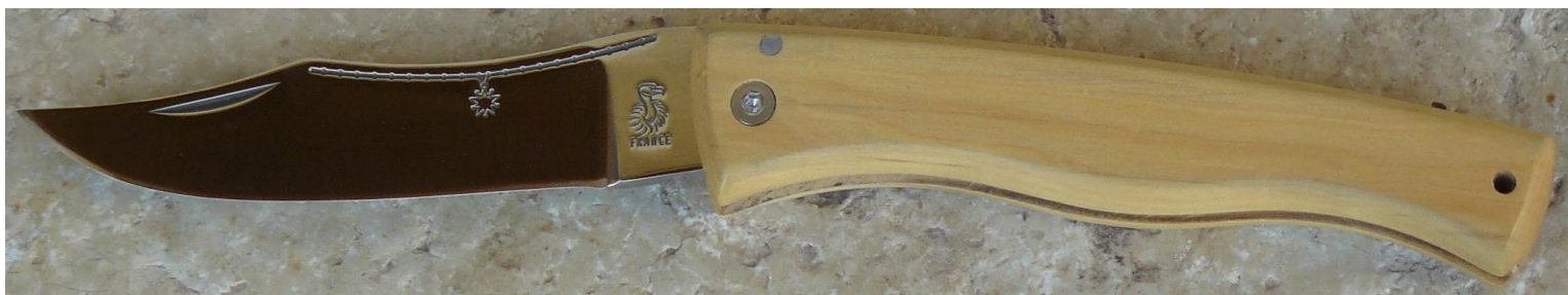
Manche : buis, vissé.