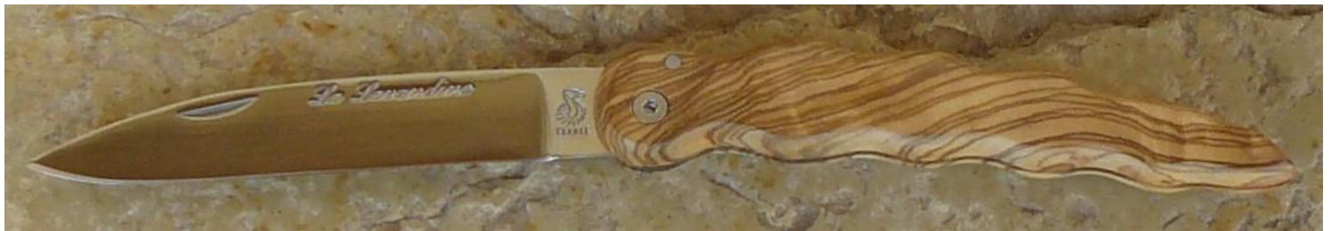
Manche : olivier, vissé.