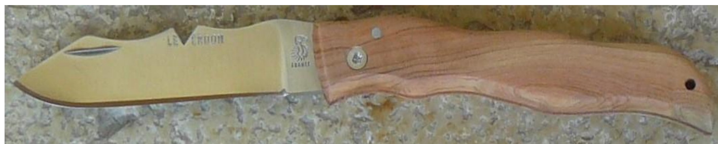
Manche : cade aussi appelé Genévrier cade ( Juniperus oxycedrus ), vissé.