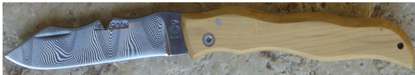
Manche : buis, vissé.