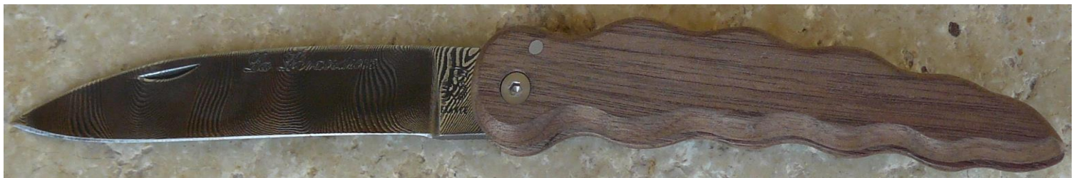
Manche : noyer, vissé.