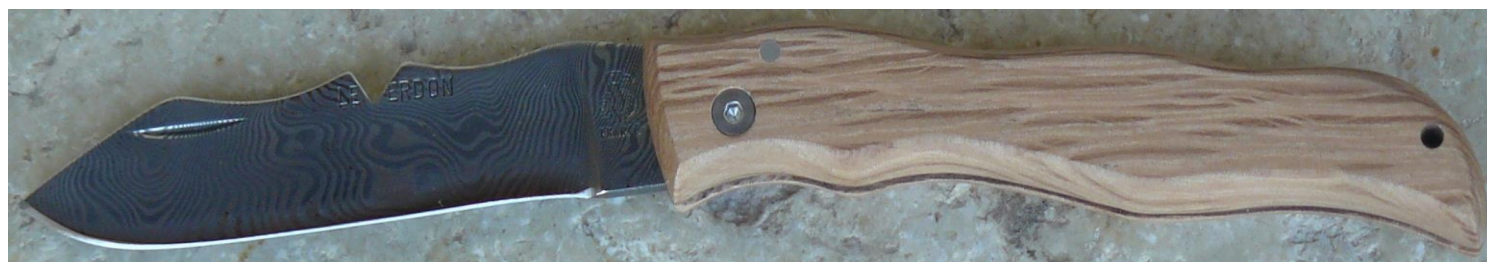
Manche : chêne vert, vissé.