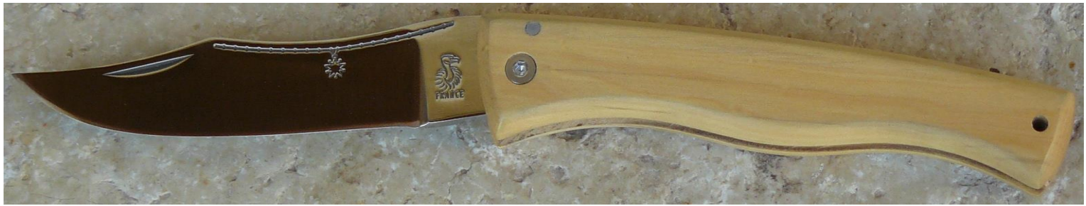
Manche : buis, vissé.