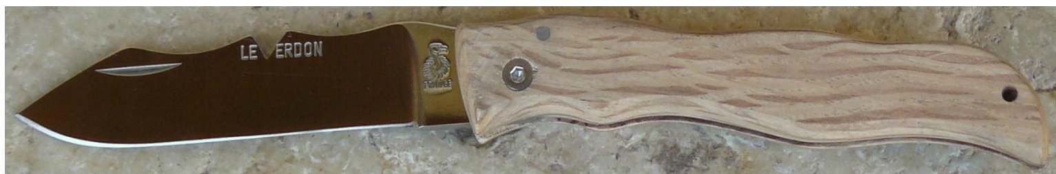
Manche : chêne vert, vissé.