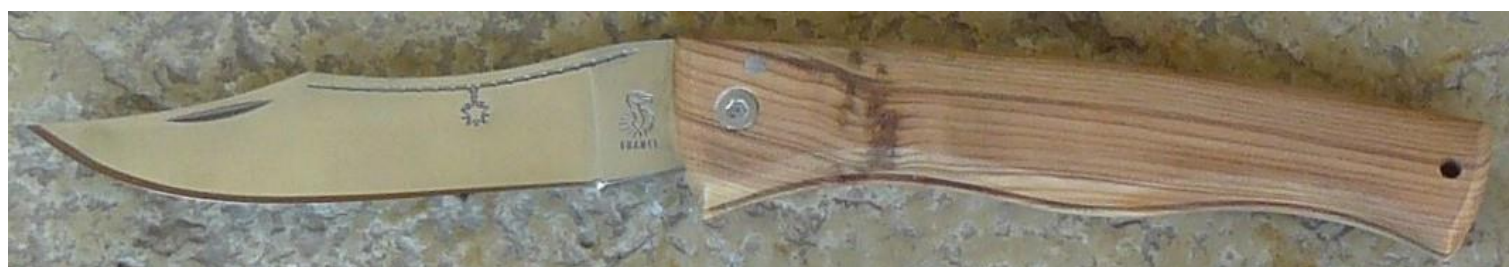
Manche : cade aussi appelé Genévrier cade ( Juniperus oxycedrus ), vissé.