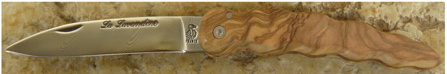
Manche : olivier, vissé.