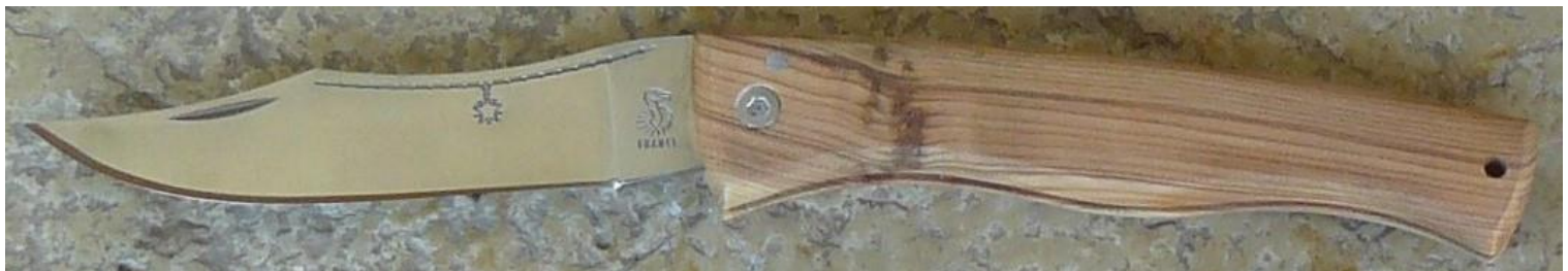
Manche : cade aussi appelé Genévrier cade ( Juniperus oxycedrus ), vissé.