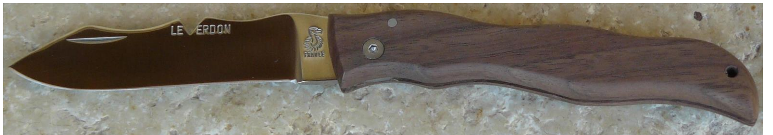
Manche : noyer, vissé.