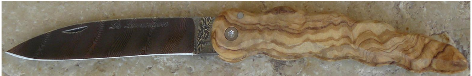
Manche : olivier, vissé.