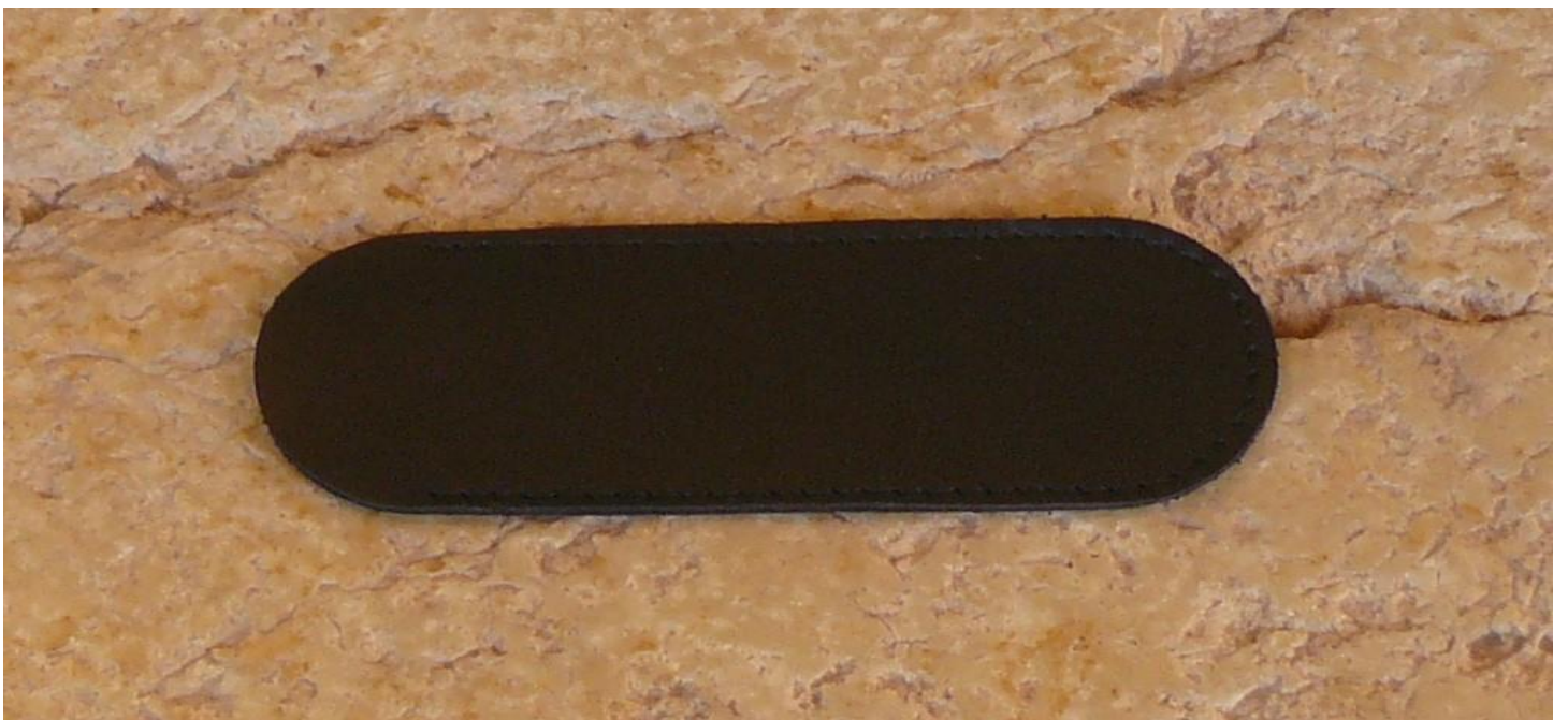
Couleur : noire.