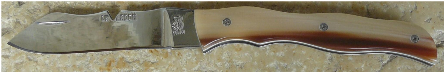
Manche : intercalaire blanc et pointe de corne blonde flammée de zébu, vissé (sans intercalaire blanc).