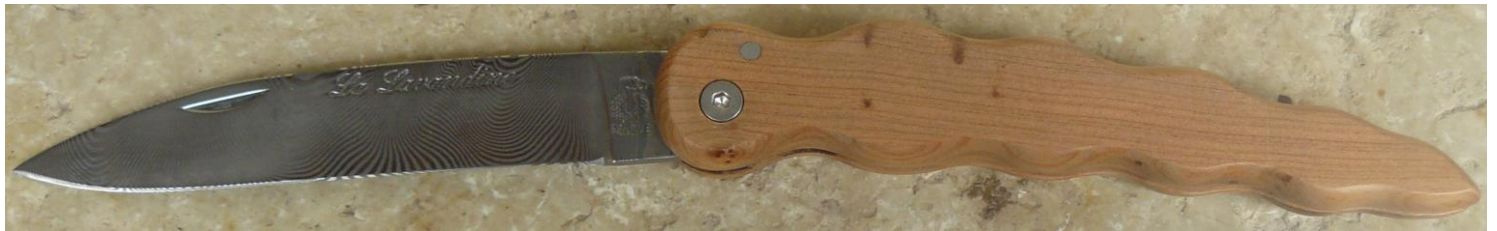
Manche : cade aussi appelé Genévrier cade ( Juniperus oxycedrus ), vissé.