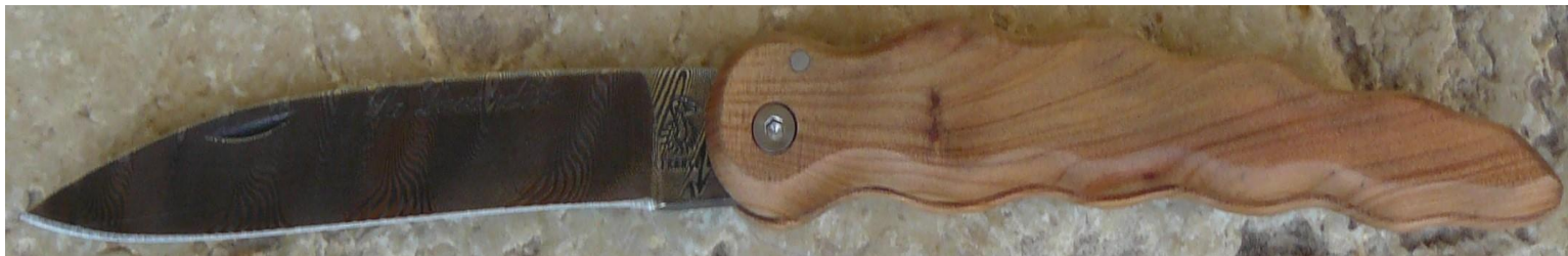
Manche : cade aussi appelé Genévrier cade ( Juniperus oxycedrus ), vissé.