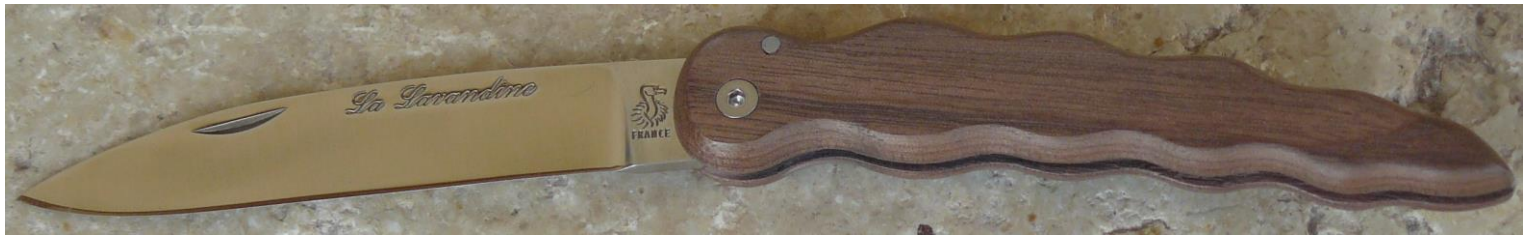
Manche : noyer, vissé.