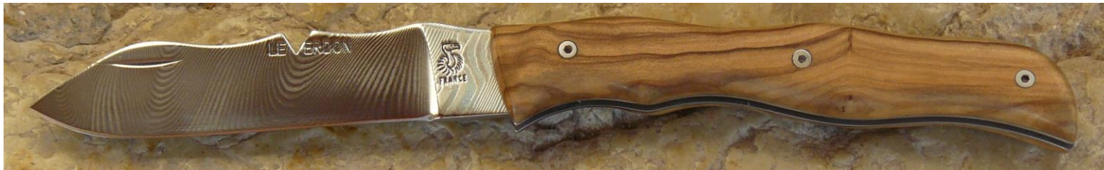
Manche : olivier de Provence (83 ou 04), vissé.