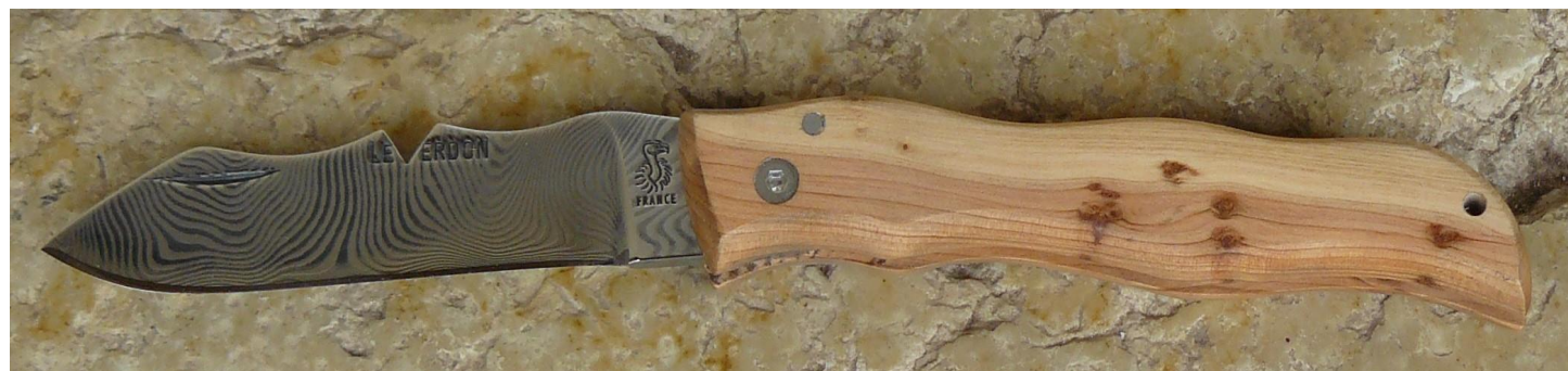
Manche : cade aussi appelé Genévrier cade ( Juniperus oxycedrus ), vissé.