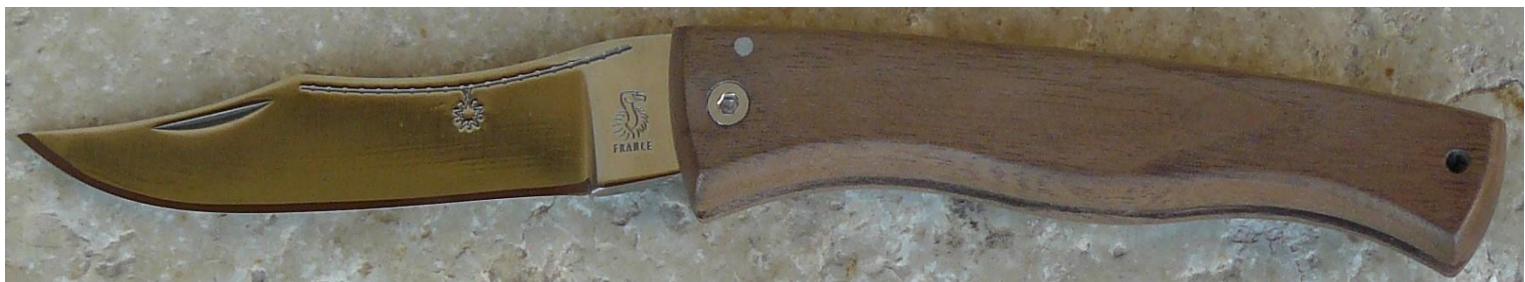
Manche : noyer, vissé.