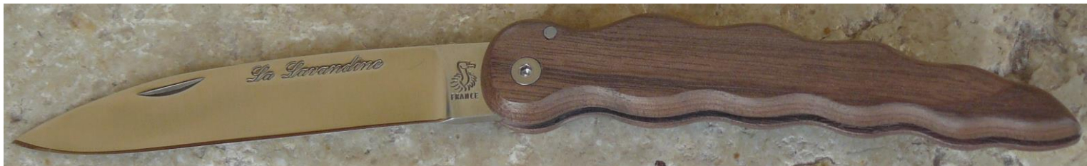
Manche : noyer, vissé.