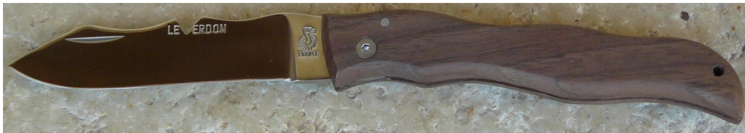
Manche : noyer, vissé.