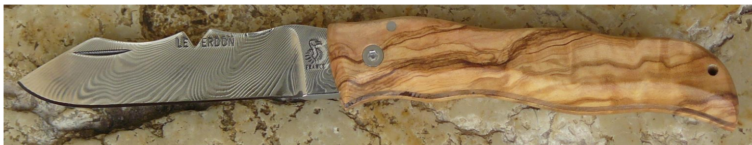
Manche : olivier, vissé.