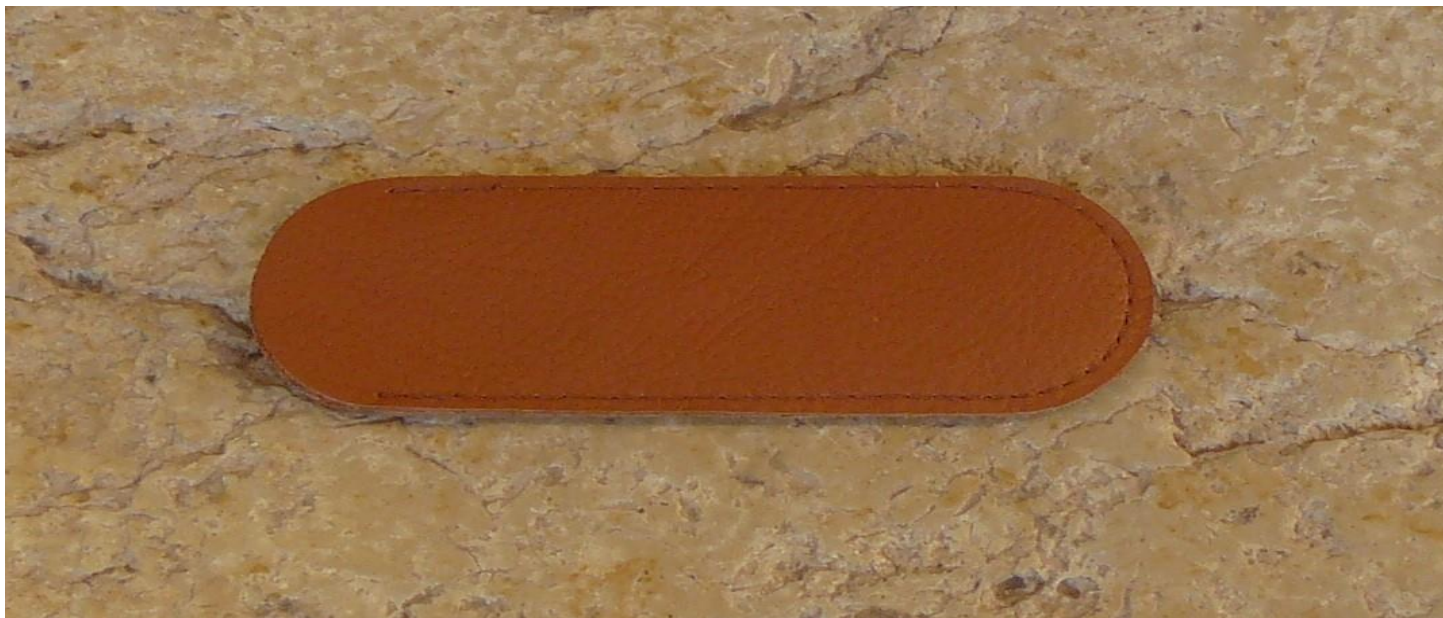
Couleur : marron claire.