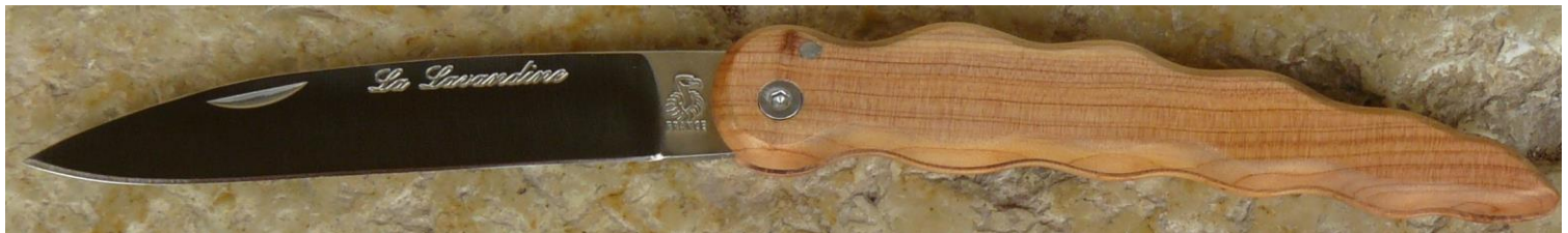
Manche : cade aussi appelé Genévrier cade ( Juniperus oxycedrus ), vissé.