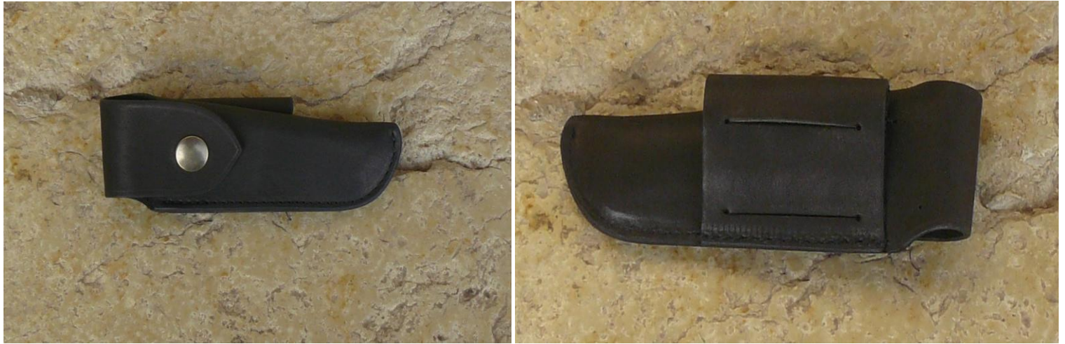
Couleur : noire.