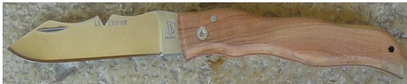
Manche : cade aussi appelé Genévrier cade ( Juniperus oxycedrus ), vissé.