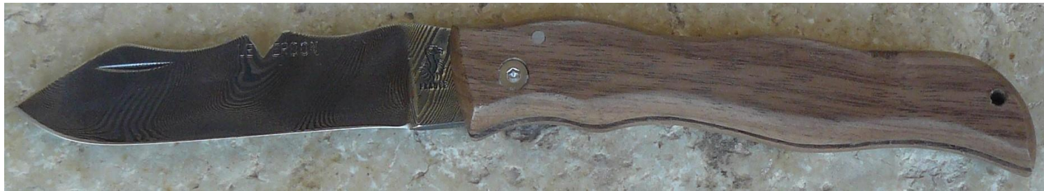
Manche : noyer, vissé.