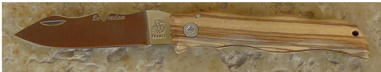
Manche : olivier, vissé.