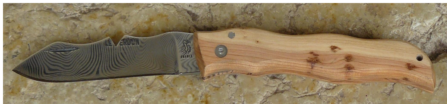
Manche : cade aussi appelé Genévrier cade ( Juniperus oxycedrus ), vissé.