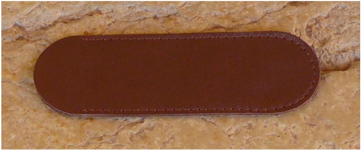
Couleur : marron foncé.