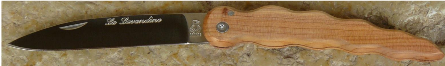
Manche : cade aussi appelé Genévrier cade ( Juniperus oxycedrus ), vissé.