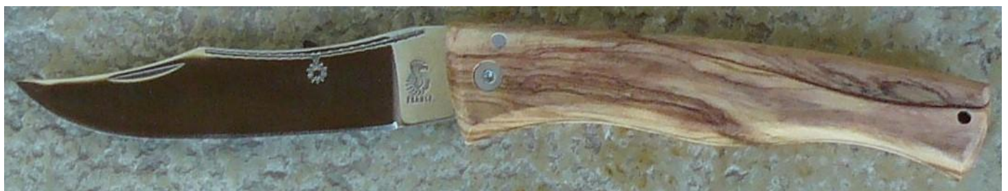
Manche : olivier, vissé. ✓ en pré-commande (délai de 3 à 4 mois)