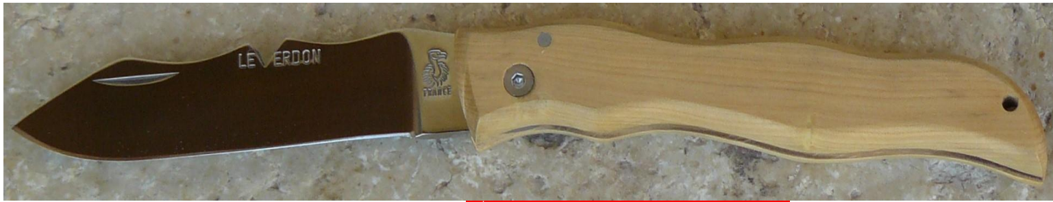
Manche : buis, vissé. ✓ en pré-commande (délai de 3 à 4 mois)