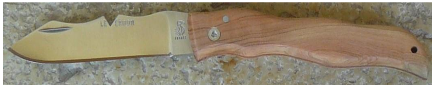
Manche : cade aussi appelé Genévrier cade ( Juniperus oxycedrus ), vissé.