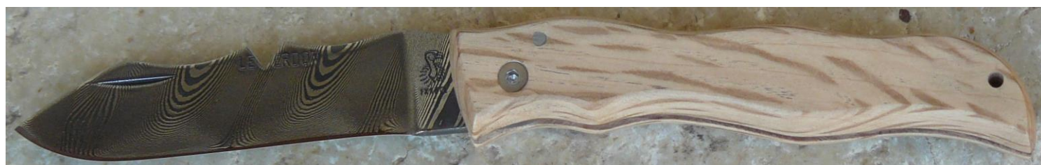
Manche : chêne vert, vissé. ✓ en pré-commande (délai de 3 à 4 mois)