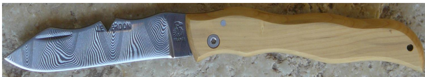
Manche : buis, vissé. ✓ en pré-commande (délai de 3 à 4 mois)