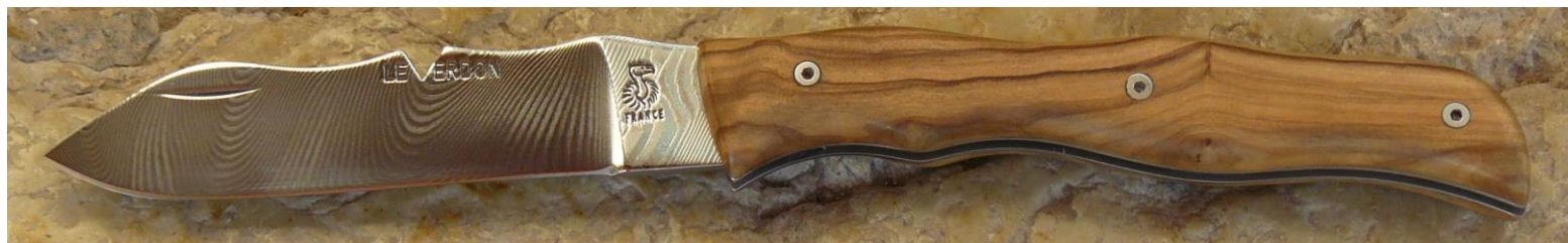
Manche : olivier de Provence (83 ou 04), vissé.