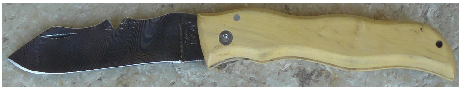
Manche : buis, vissé. ✓ en pré-commande (délai de 3 à 4 mois)