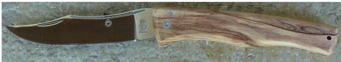
Manche : olivier, vissé. ✓ en pré-commande (délai de 3 à 4 mois)