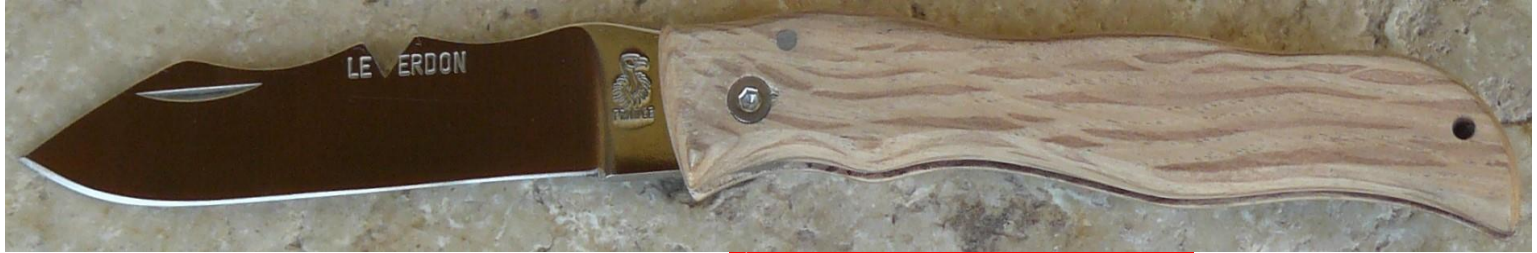
Manche : chêne vert, vissé. ✓ en pré-commande (délai de 3 à 4 mois)