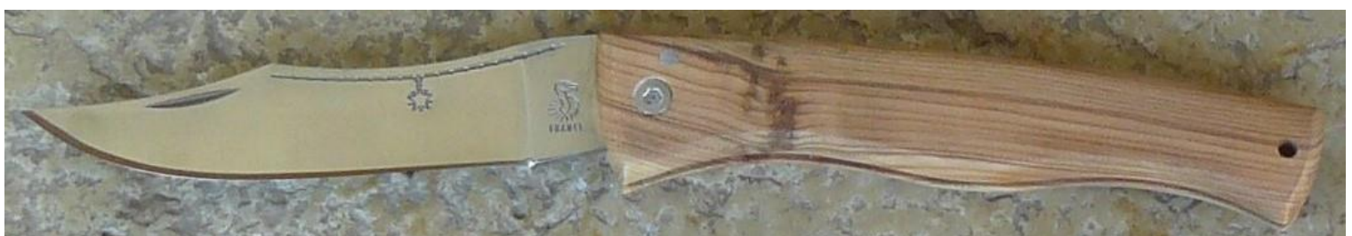
Manche : cade aussi appelé Genévrier cade ( Juniperus oxycedrus ), vissé.