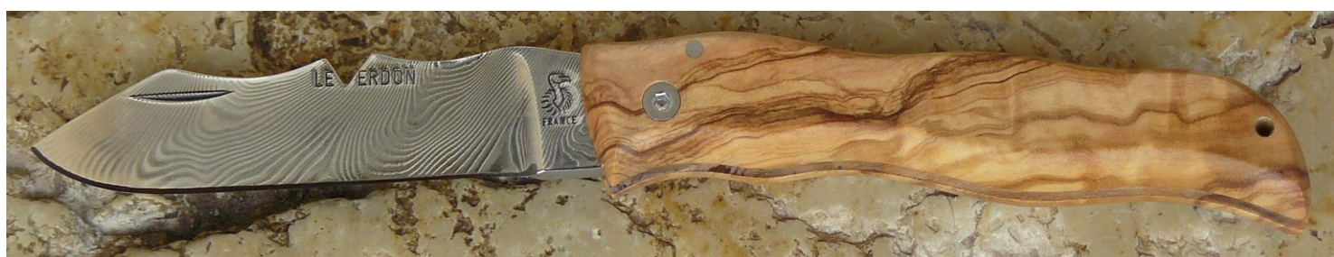
Manche : olivier, vissé. ✓ en pré-commande (délai de 3 à 4 mois)