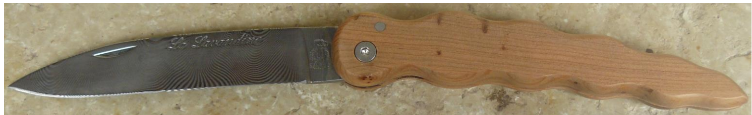
Manche : cade aussi appelé Genévrier cade ( Juniperus oxycedrus ), vissé.