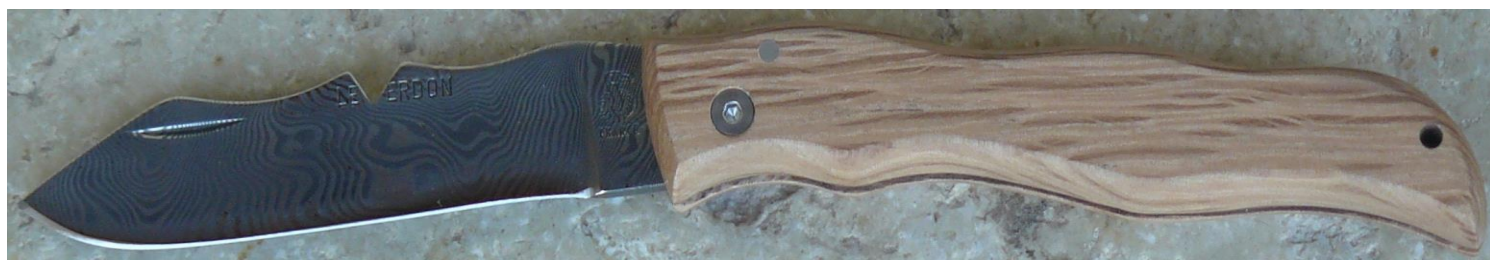
Manche : chêne vert, vissé. ✓ en pré-commande (délai de 3 à 4 mois)