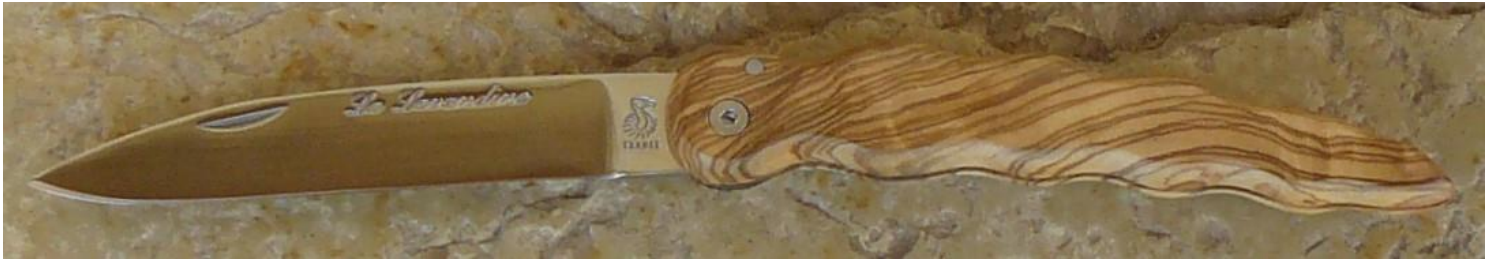
Manche : olivier, vissé.