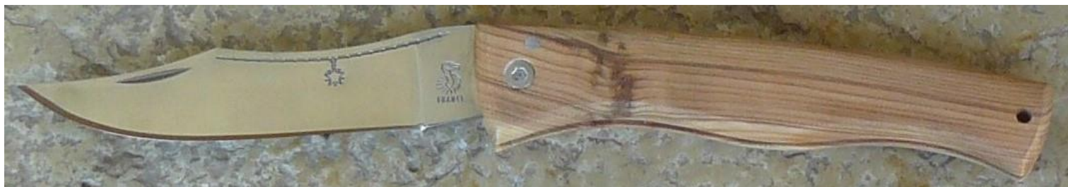
Manche : cade aussi appelé Genévrier cade ( Juniperus oxycedrus ), vissé.