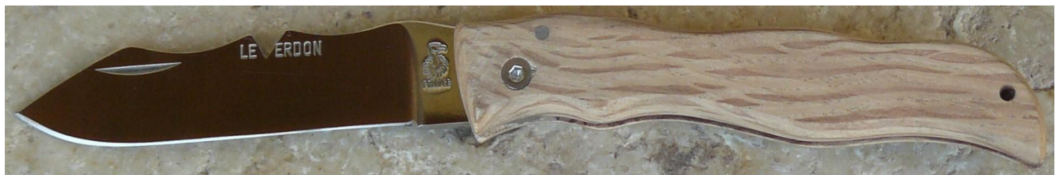
Manche : chêne vert, vissé.