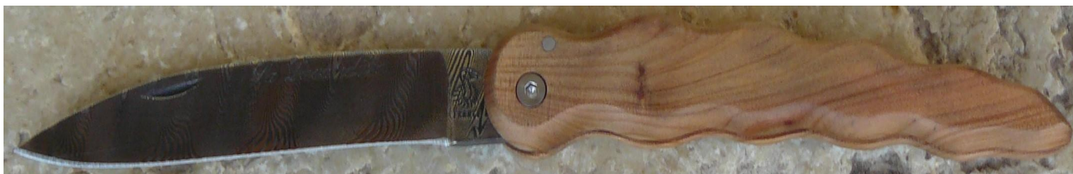
Manche : cade aussi appelé Genévrier cade ( Juniperus oxycedrus ), vissé.