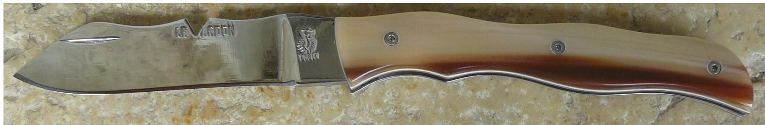
Manche : intercalaire blanc et pointe de corne blonde flammée de zébu, vissé (sans intercalaire blanc).