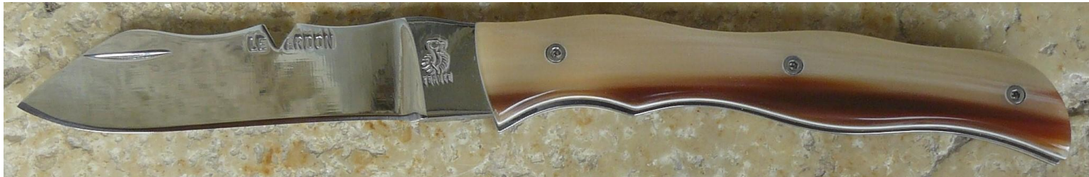
Manche : intercalaire blanc et pointe de corne blonde flammée de zébu, vissé (sans intercalaire blanc).