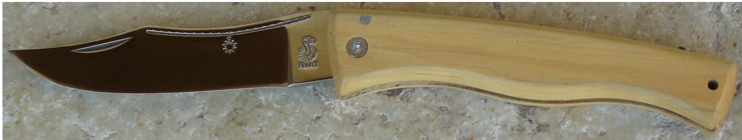
Manche : buis, vissé.