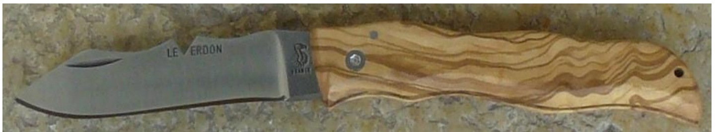
Manche : olivier, vissé. ✓ en pré-commande (délai de 3 à 4 mois)