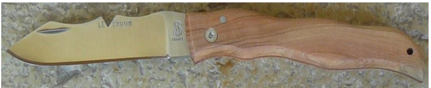
Manche : cade aussi appelé Genévrier cade ( Juniperus oxycedrus ), vissé.