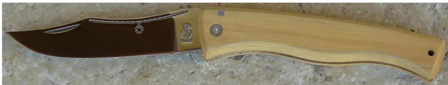
Manche : buis, vissé.